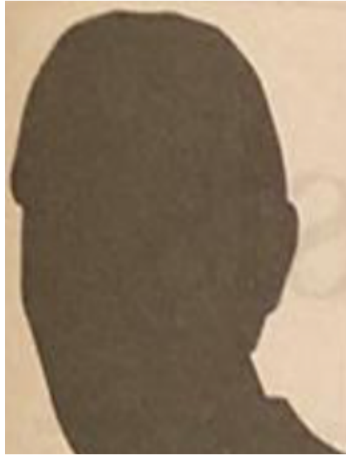
Jan W. van Randen (21 jaar)

In 1943 is hij ondergedoken om aan de verplichtte Arbeitseinsatz te ontkomen. Zijn precieze rol in het verzet is niet bekend. Wel werden tijdens zijn arrestatie veel wapens en munitie gevonden.